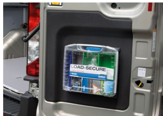
i-BOXX 72 mit Wandhalter