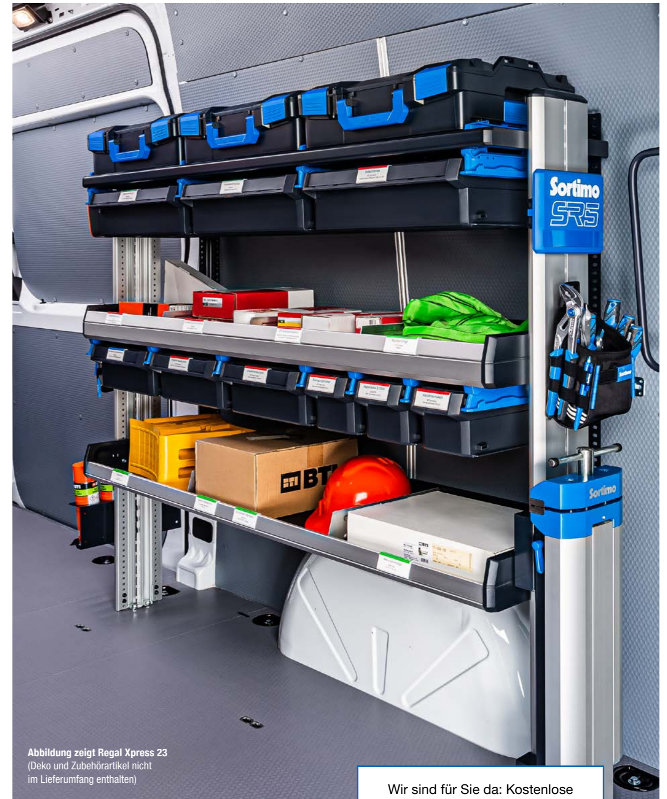
Abbildung zeigt Regal Xpress 23 (Deko und Zubehörartikel nicht im Lieferumfang enthalten)

Wir sind für Sie da: Kostenlose Servicehotline ☎ 0800 7678466